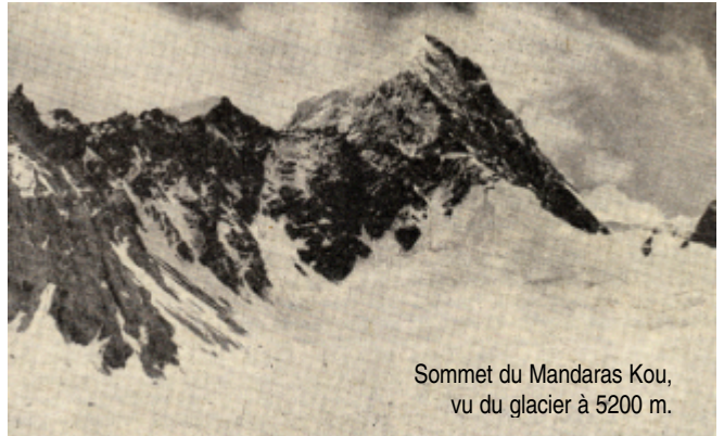
Sommet du Mandaras Kou, vu du glacier à 5200 m.

Nos camarades polonais, moins pressés que nous,