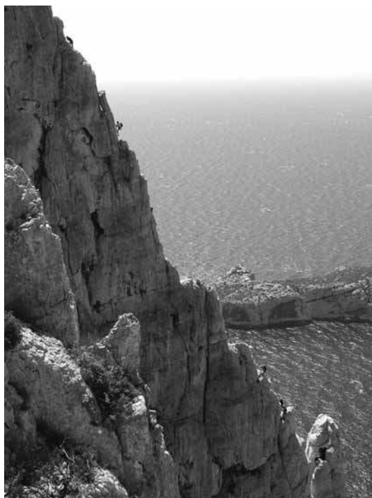
Le Gums a investi l'arête de Marseille

Le traditionnel rassemblement de printemps eut lieu cette année à Cassis. À vrai dire il y eut plutôt deux rassemblements dans le même camping : celui du bas et celui du haut !!! *