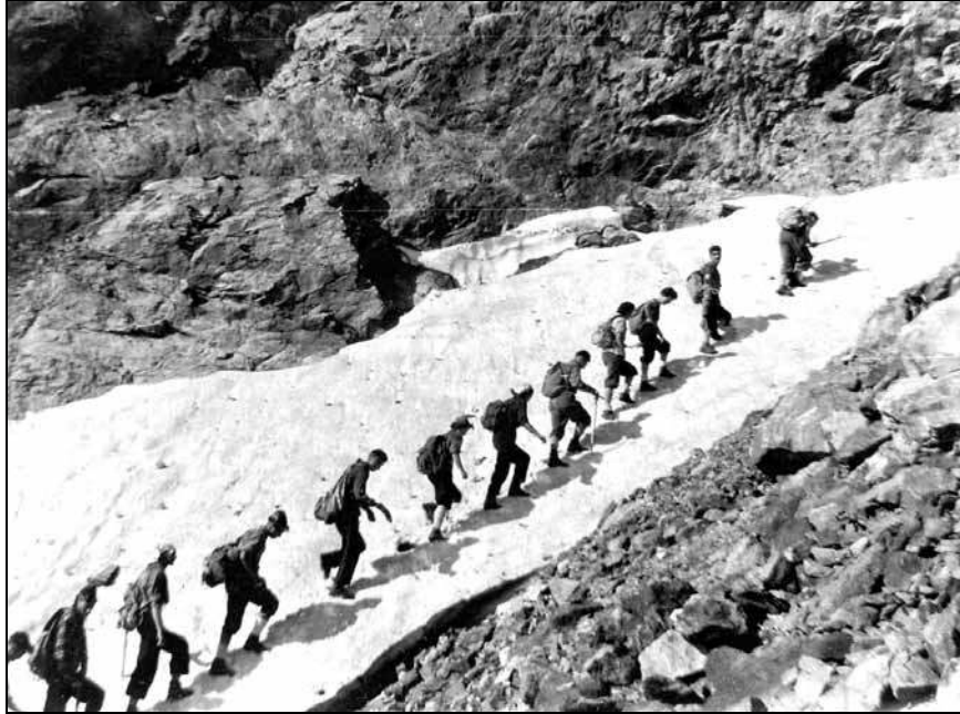
« Millepatus alpinus gumiensis » ou, dit plus sobrement, caravane du GUMS progressant vers le Coup de Sabre, été 1952, stage d'Ailefroide