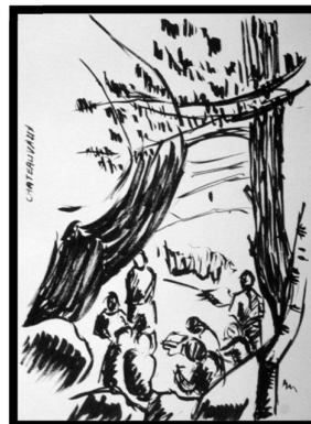
Châteaueaux par Yvon Lagadec