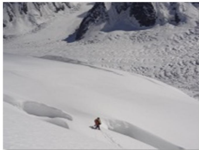
La fin des aventures d'Api et Doda en page 16.

Retrouvez dans ce Crampon un peu plus loin :