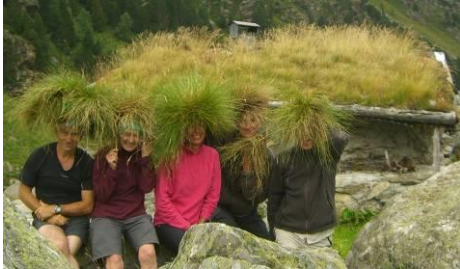
Couverture végétale intégrale

Vive le voyage, qui incite à l'échange et à se dissoudre dans la nature.