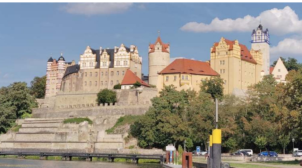
Le château de Till l'Espiegle à Bernburg

A un moment, un panneau indiquait que vers la gauche se trouvait le « sanctuaire circulaire » de Pömmelte. Dans cette plaine, c'est un équivalent temporel de Stonehenge, sur une vague éminence qui devait être à l'abri relatif des inondations, on a retrouvé des traces d'un culte de l'âge du bronze : restes de palissades concentriques dessinant des cercles de plusieurs dizaines de mètres de diamètres, traces de huttes de grande taille et évidemment tombes. Les palissades ont été reconstituées sur place pour donner une idée de ce que pouvait être le site. Ouvert à la visite libre, nous étions seuls à circuler entre les poteaux colorés ou à monter sur la tour d'observation pour une vue d'ensemble. Le centre d'accueil était très accueillant et nous a permis de pique-niquer pendant que la pluie finissait de tomber.