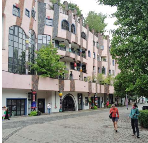
La Citadelle Verte, immeuble Hundertwasser à Magdeburg

minutes suffisent pour aller d'un quai à un autre, car tous sont au même niveau, donc pas d'escaliers ou ascenseurs. Et le site internet des chemins de fers allemands indique précisément quels sont les quais d'arrivée et de départ.