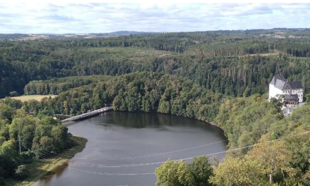
La boucle de la Saale à Burgk

Le parcours suit alors les méandres de la Saale, devient gravillonné et moins roulant quand, soudain, une portion en bitume suscite l'espoir d'une avancée confortable. Espoir vite déçu par un écriteau qui annonce une montée à 20 %. Il faut alors passer en danseuse et Suzanne met bientôt pied à terre. Même avec l'aide de l'électricité, le redémarrage après le virage en épingle qui permet d'admirer la rivière est difficile. Le bitume s'arrête quand la montée prend fin et l'on retrouve les gravillons pour la descente jusqu'au méandre suivant. Midi sonne quand on rejoint le pittoresque village de Ziegenrück où l'on a juste le temps d'acheter le pique-nique de midi