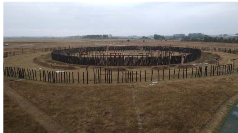
Le sanctuaire circulaire de l'âge du bronze, reconstitué à Pömmelte

Autant vous dire que d'un commun accord, arrivant à Barby, nous avons décidé de ne pas faire le détour pour aller jusqu'à l'embouchure, mais d'obliquer vers l'ouest et Schönebeck, en embrayant sur la véloroute de l'Elbe. Était-ce la météo, le ciel bas ou la fatigue accumulée, toujours est-il que de Barby à Schönebeck, nous avons eu