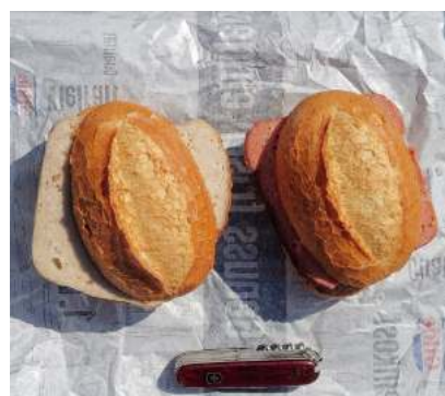
Une spécialité locale : le Leberkässemmel

Il faut dire ici quelques mots sur les campings où nous avons dormi. Ils sont suffisamment nombreux sur la véloroute pour autoriser des étapes raisonnables, mais pas pour se laisser tout loisir de raccourcir ou rallonger une étape en cas de fatigue ou de conditions météo défavorables. Par mail, j'avais contacté ceux qui convenaient à nos étapes pour les avertir de notre venue, mais en tant que campeur à vélo, ce n'est pas vraiment nécessaire, surtout si vous faites le parcours en dehors des vacances scolaires des Länder concernés. En effet, les vacances d'été sont en général en juillet en Thuringe et en Saxe, mais en août en Bavière. Car, comme en France, il y a dans ces campings beaucoup de mobil-homes, souvent privatisés, ainsi que des emplacements pour camping-cars et ce sont ces derniers qu'il faut réserver. Il reste toujours des places pour caser des tentes itinérantes. En outre,