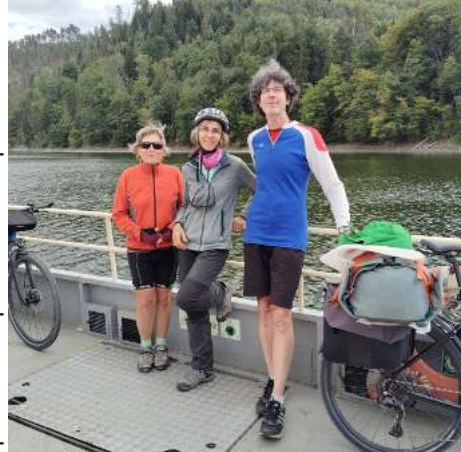
Sur le bac d'Altenroth

zanne, qui, les jours précédents, mettait des bouchons d'oreille pour être certaine de ne pas être dérangée par les voisins, n'en a pas mis ce soir-là. Du moins en début de nuit, car le lendemain matin, elle nous a avoué que s'étant réveillée durant la nuit, elle n'avait entendu absolument aucun bruit et à force d'écouter et d'espérer percevoir un signe de vie sonore, elle avait remis ses bouchons d'oreille pour stopper cet effort d'audition qui la maintenait éveillée.