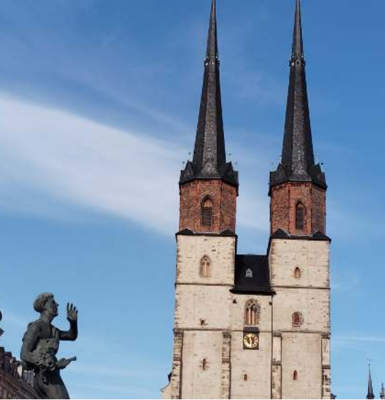
L'église Sainte-Marie à Halle