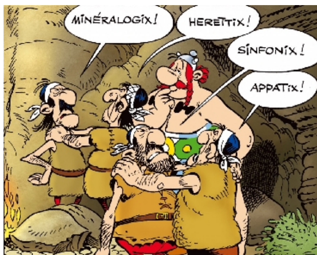
Formation des cordées