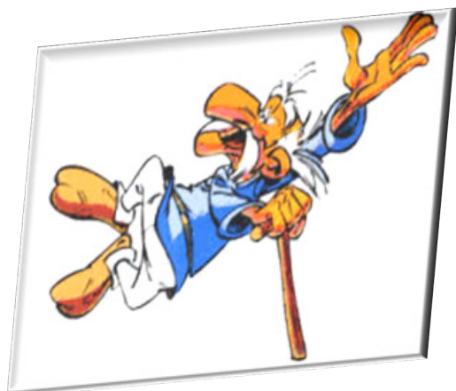
Après trois jours d'escalade sous le soleil !