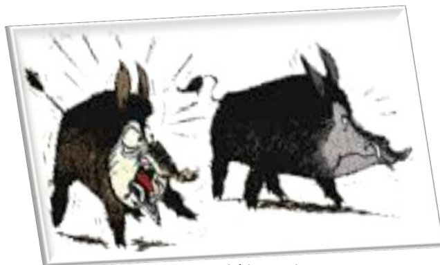
Si Michèlix ne leur trouve pas vite une crêperie, on est cuits...