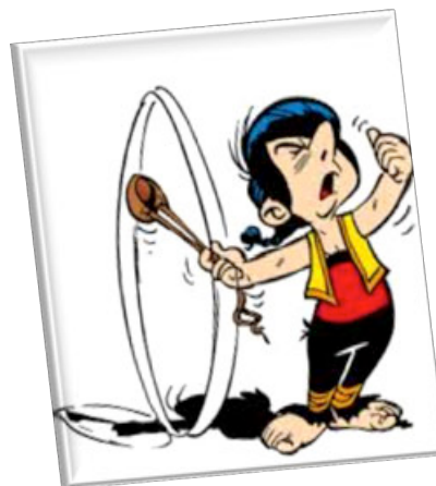
Et hop ! Tous dans les minibus !!