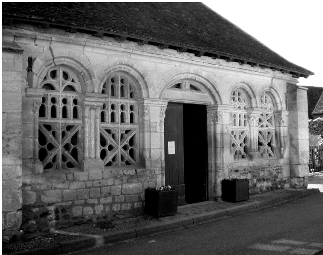
Église de Moutiers en Puisaye

En résumé, nous avons passé un week-end superbe, aux activités variées et dans la bonne humeur. Rendez-vous pour le prochain grand week-end de l'Ascension en Côte d'Armor.