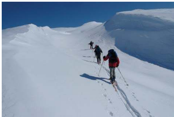
Crête de Dormillouse

alors... descente géniale, extra. Au 6 e jour, super neige, enfin du beau ski, godilles enthousiastes ; retour au Laus.