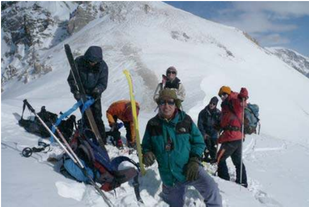
FBL d'ici et maintenant