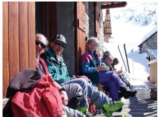
Casse-croûte ... pense la Renarde