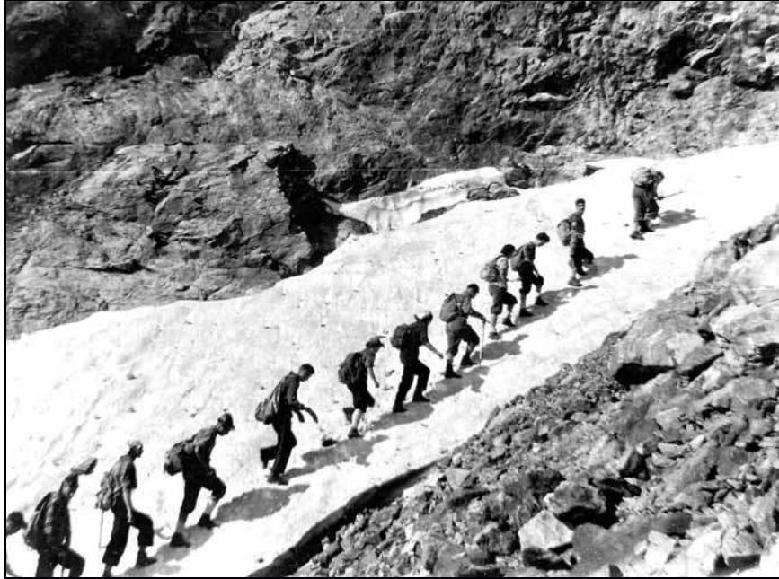
« Millepatus alpinus gumiensis » ou, dit plus sobrement, caravane du GUMS progressant vers le Coup de Sabre, été 1952, stage d'Ailefroide