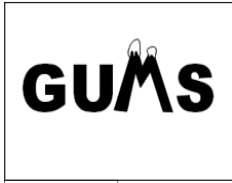
D 9 voix