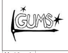
H 12 voix